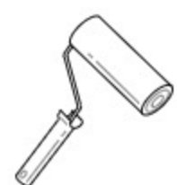
Валик для водно-дисперсионных красок